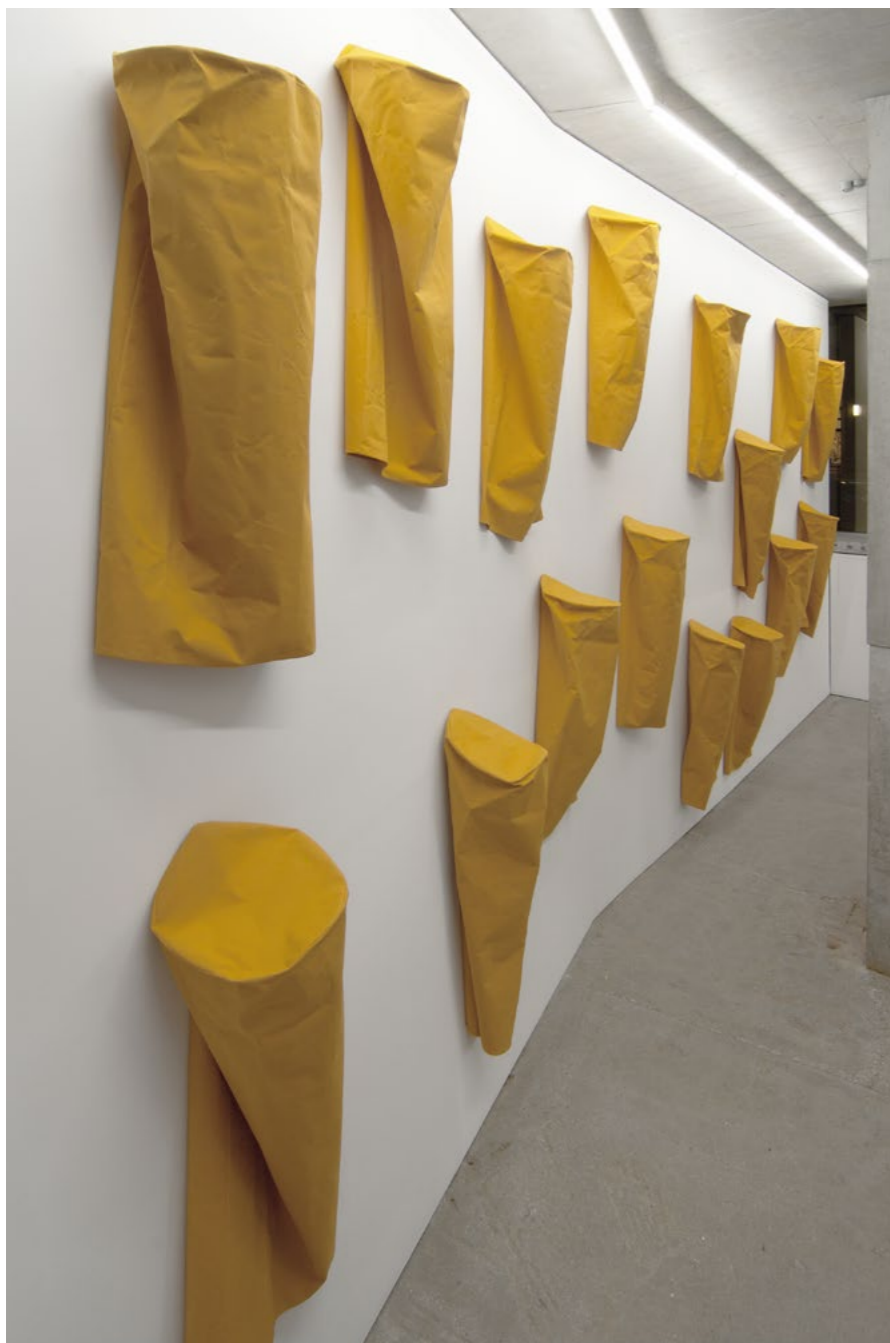
Franz Erhard Walther 24 Gelbe Säulen / 24 Yellow Columns, 1982 Sewn dyed cotton fabric (16 of 24 parts) Dimensions vary by installation