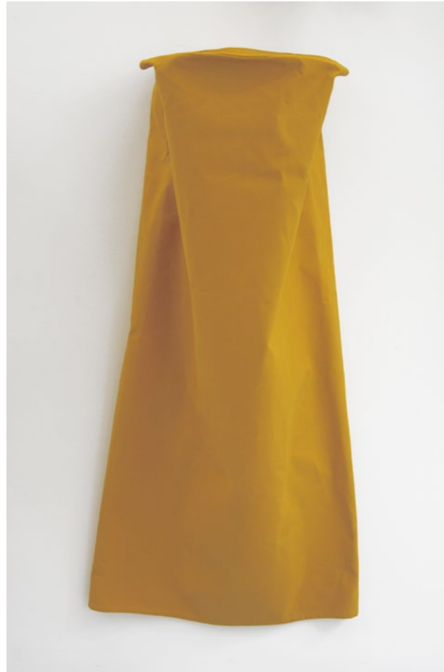
Franz Erhard Walther 24 Gelbe Säulen / 24 Yellow Columns, 1982 Sewn dyed cotton fabric (detail) Dimensions vary by installation