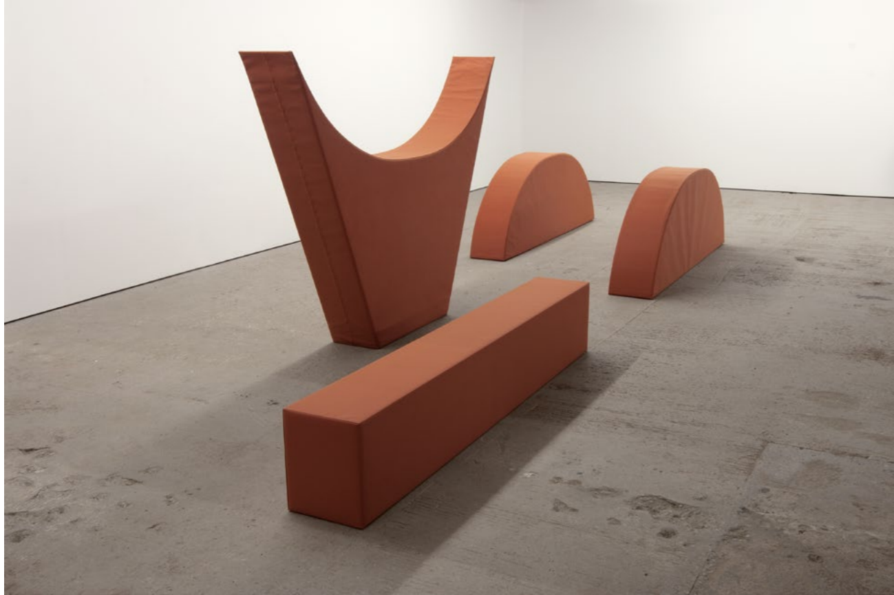
Franz Erhard Walther Vier Formen ZIEGELTON / Four Shapes BRICK TONE, 2008 Sewn dyed cotton fabric, foam, nettle cloth (4 parts) Dimensions vary by installation