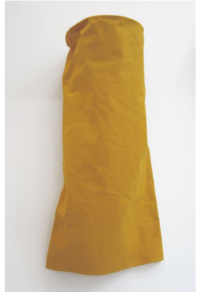
Franz Erhard Walther 24 Gelbe Säulen / 24 Yellow Columns, 1982 Sewn dyed cotton fabric (detail) Dimensions vary by installation