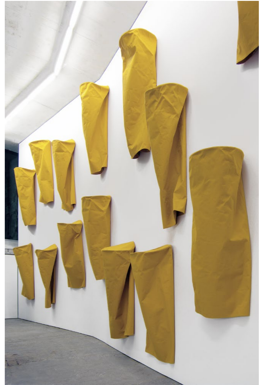
Franz Erhard Walther 24 Gelbe Säulen / 24 Yellow Columns, 1982 Sewn dyed cotton fabric (16 of 24 parts) Dimensions vary by installation