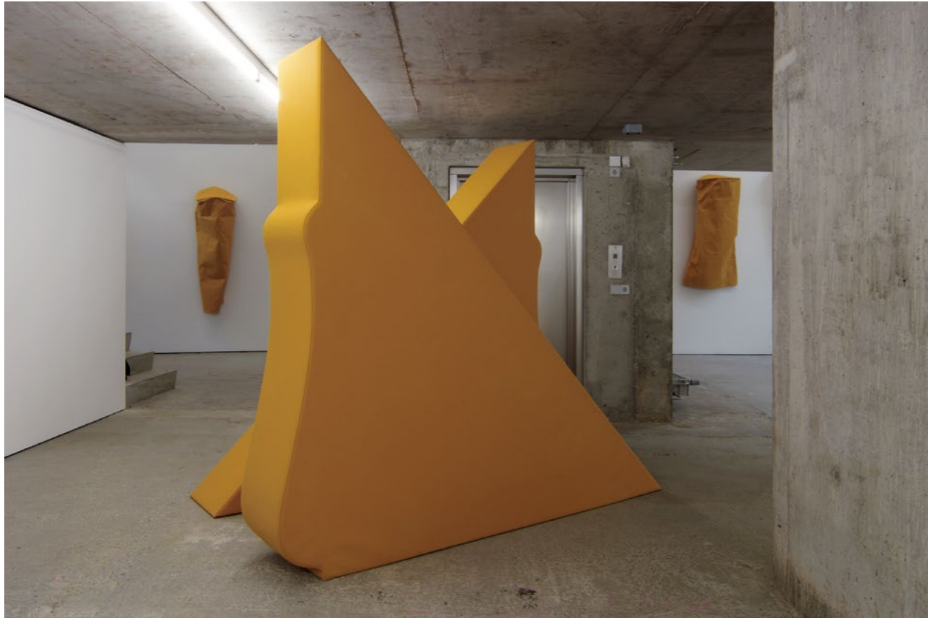
Franz Erhard Walther Körperformen GELB / Body Shapes YELLOW, 2012 Sewn dyed cotton fabric, foam, nettle cloth (2 parts) Dimensions vary by installation