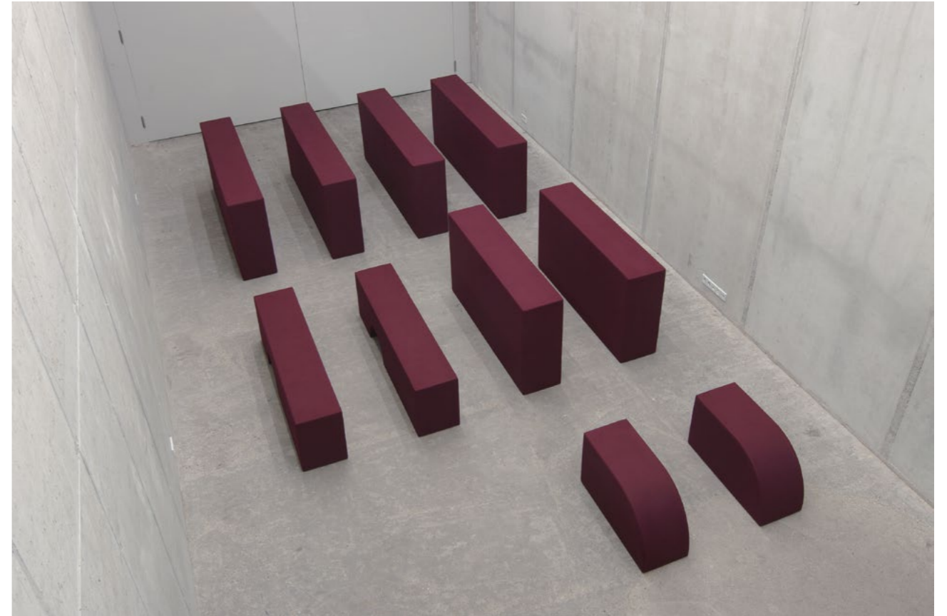
Franz Erhard Walther Körperformen WEINROT / Body Shapes BORDEAUX RED, 2013 Sewn dyed cotton fabric, foam, nettle cloth (10 parts) Dimensions vary by installation

In einer Rückschau auf die Achtzigerjahre zeigen wir in der gemeinsam mit Franz Erhard Walther konzipierten Ausstellung eine seiner umfangreichsten, bislang noch unveröffentlichten Wandinstallationen: 24 Gelbe Säulen von 1982, ein Ensemble von mannshohen, aus gelbem Baumwollstoff genähten Säulenformen. Das antikisierende Motiv ist kein Zufall. Von Beginn an suchte Walther nach einer Ästhetik, die, so gut sie es vermag, den Herausforderungen des Zeitgeschmacks entgeht, ja in ihrer Chromatik, Materialität und Formentwicklung nach Zeitlosem, vielleicht auch Unzeitgemäßem greift. Das macht den stillen Ernst seines Werkes aus, das zugleich seit fünf Jahrzehnten spielerisch bleibt. Mehr noch, es animiert ludische Triebe und eine Vorstellungskraft, die angesichts eines Offenen Werkbegriffs beweglich zu bleiben hat.