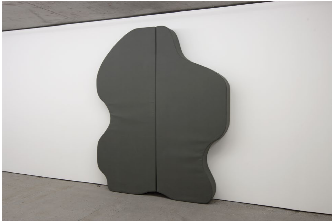
Franz Erhard Walther Körperformen DUNKELGRAU / Body Shapes DARK GREY, 2006 Sewn dyed cotton fabric, foam, nettle cloth (2 parts) Dimensions vary by installation