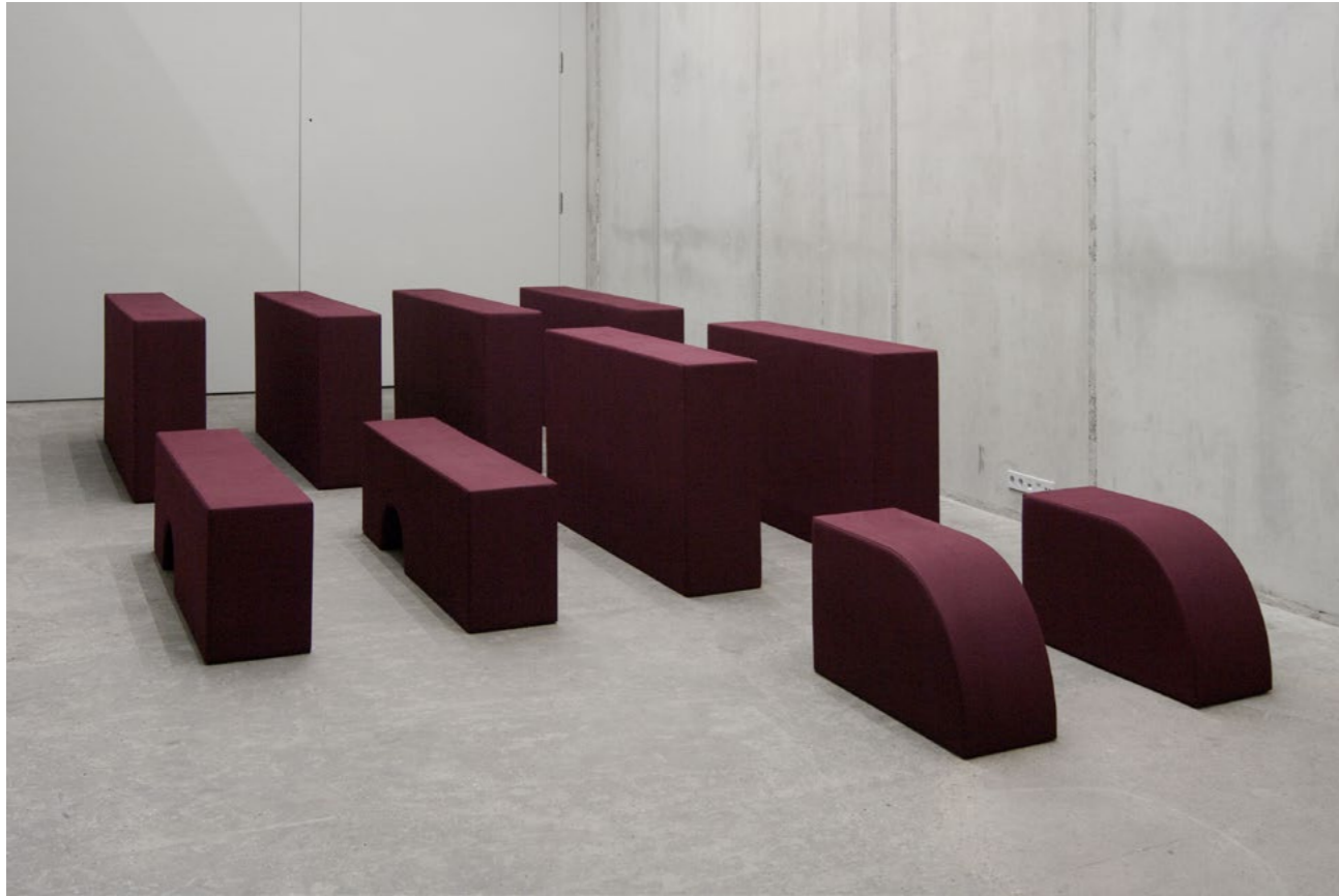
Franz Erhard Walther Körperformen WEINROT / Body Shapes BORDEAUX RED, 2013 Sewn dyed cotton fabric, foam, nettle cloth (10 parts) Dimensions vary by installation