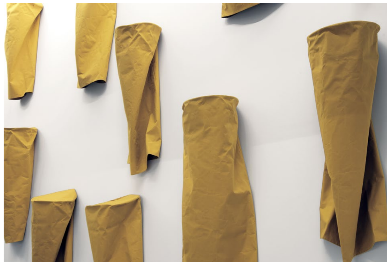
Franz Erhard Walther 24 Gelbe Säulen / 24 Yellow Columns, 1982 Sewn dyed cotton fabric (16 of 24 parts) Dimensions vary by installation